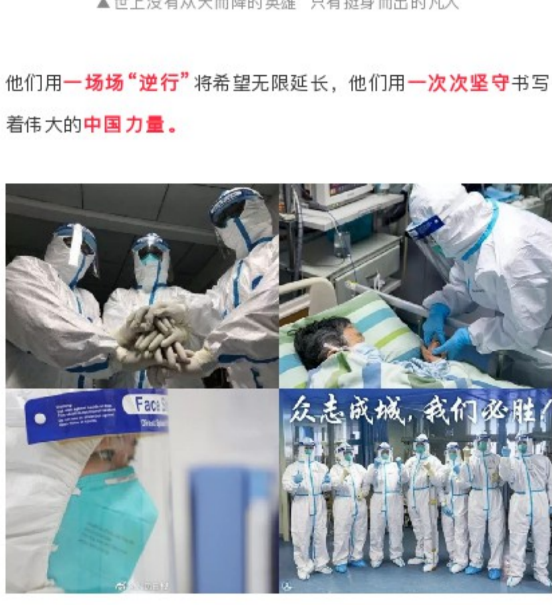
▲世上没有从天而降的英雄 只有挺身而出的凡人

自新型冠状病毒感染的肺炎疫情发生以来，全国各地广大医务工作者 星夜驰援，义无反顾 地站在最前线，以 “最美逆行” 奔赴战场，以实干担当勇挑重担，用生命守护健康。