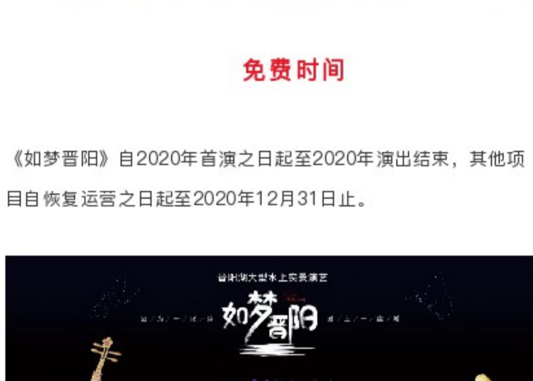
▲希望如期而至的不止春天 还有疫情过后平平安安的您

为 致敬奋斗在“抗疫”一线的最美逆行者们 ，为全国医务工作者及其他抗击疫情一线工作者在晋阳湖公园提供相关免费政策。具体内容如下：